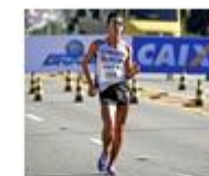
ATLETISMO MARCHA ATLÉTICA