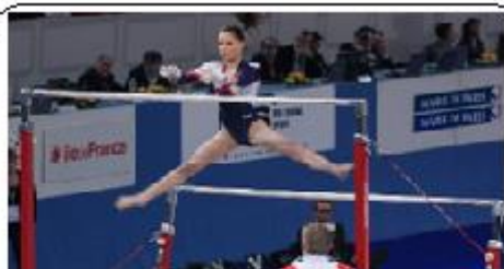
GINÁSTICA ARTÍSTICA: BARRA ASSIMÉTRICA