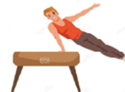
GINÁSTICA ARTÍSTICA: CAVALO