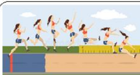
ATLETISMO SALTO TRIPLO