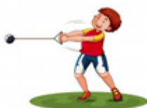
ATLETISMO ARREMESSO DE MARTELO